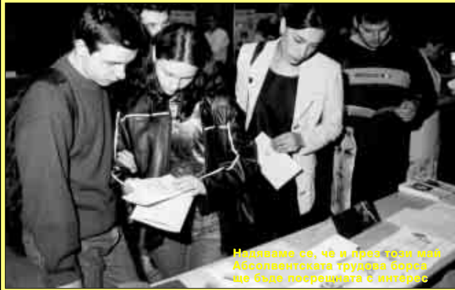
Надяваме се, че и през този май Абсолвентската трудова борса ще бъде посрещната с интерес

търсят млади, току-що завършили специалисти. Това отчетоха участниците в събирането. През тази година абсолвентите в университета са 1410, от които най-голям е »2